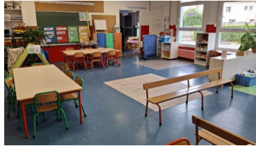
La salle bleue