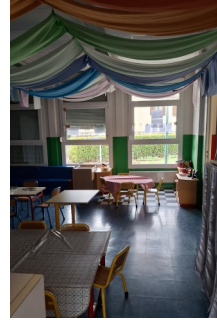
La salle rose