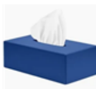
2 BOITES DE MOUCHOIRS