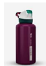
1 GOURDE facile à utiliser par votre enfant