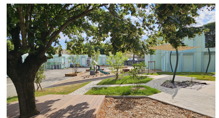
La cour de récréation

Une vidéo pour faire « une visite virtuelle » de l'école est disponible sur le site internet de l'école (onglet « accueil des nouveaux élèves ») : https://maternelle-provence-guilherand-granges.web.ac-grenoble.fr/