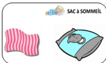
Dans « le sac à sommeil » prêter par l'école :