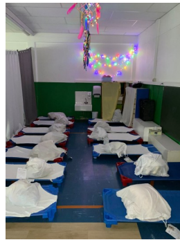
La salle « du petit repos »