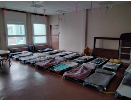
La salle « du gros dodo »