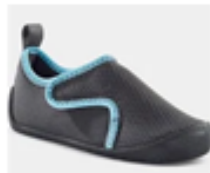
1 PAIRE DE CHAUSSONS qui tiennent bien aux pieds facile à enfiler par votre enfant