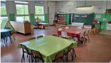
La salle violette