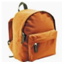
1 PETIT SAC A DOS