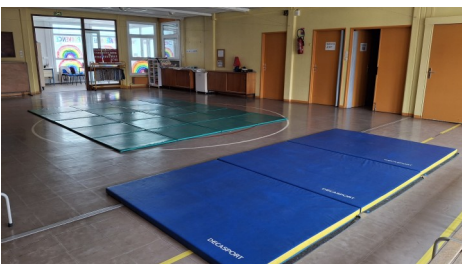
La salle de sports