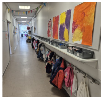
Le couloir et les porte-manteaux