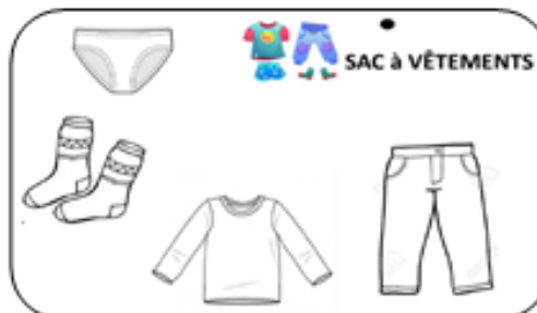
Dans « le sac à vêtements » prêter par l'école :

1 CHANGE COMPLET à adapter en fonction de la saison